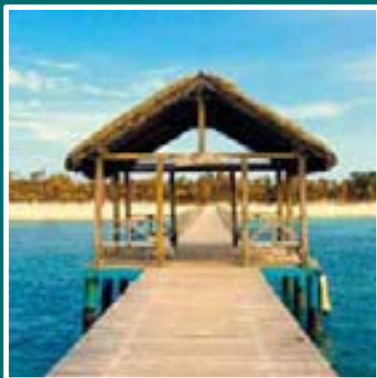
» Isla de la Juventud p12