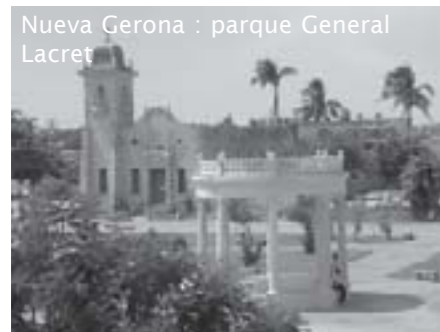
Nueva Gerona : parque General Lacret

Wie Cuba echt volledig wil gezien hebben, dient toch één keer het hoofdeiland te verlaten en een tocht te ondernemen naar Isla de la Juventud. Het eiland wordt bitter weinig bezocht door toeristen, heeft nochtans een aantal culturele (historische) en vooral ook natuurlijke trekpleisters en toont daarenboven Cuba in al zijn echtheid.