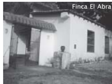
Finca El Abra

naar het – toen nog – Isla de Pinos gedeporteerd waar hij negen weken doorbracht in de Finca El Abra. Die Finca is vandaag de dag nog te bezoeken, op een boogscheut van Nueva Gerona.