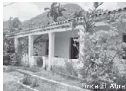
Finca El Abra

Wie het eiland wil bezoeken, kan erheen varen met één van de ferrys die op en af varen tussen Surgidero de Batabanó (aan de zuidkust van de provincie Havana) en Nueva Gerona, de hoofdplaats van Isla de la Juventud, of kan erheen vliegen vanuit Havana. Hoe dan ook, de verkenning begint in Nueva Gerona, de hoofdplaats (met ongeveer 15.000 inwoners – van de in totaal 75.000 op het eiland).