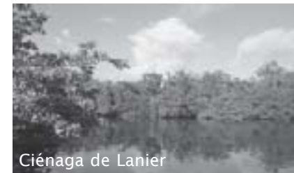
Ciénaga de Lanier

Na zijn vrijlating trok Castro naar Mexico waar hij zijn volgende stappen ging voorbereiden. De Presidio Modelo is in elk geval een ietwat grimmig maar desalniettemin intrigerend en interessant bezoek.