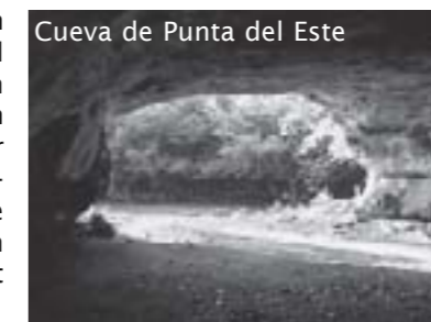
Cueva de Punta del Este

Hier vond men in 1910 een aantal grotschilderijen die erop duiden dat de inheemse indiaanse bevolking hier reeds aanwezig was. Meer dan 200 pictogrammen zijn teruggevonden op de wanden en het plafond van deze grot en men denkt hier te maken te hebben met een soort zonnecalender.