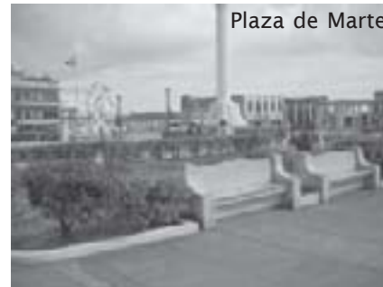
Plaza de Marte

Maar ja hoe help je honderdduizenden, dat kan niet op enkele weken, er was zoveel schade, zoveel te herstellen, en nog steeds, dat vraagt tijd en geduld. Maar de Santiagueros zijn sterk, optimistisch en binnen enkele jaren hebben ze hun stad terug, nog mooier en nog gezelliger, ze zullen 25 oktober niet snel vergeten.