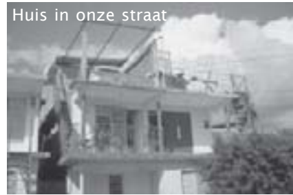
Huis in onze straat

Op weg naar Santiago, een beetje ongerust over wat we gaan aantreffen na alle beelden die we in de Cubaanse pers gezien hadden en wat we van de familie gehoord hadden.