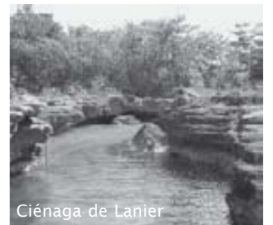
Ciénaga de Lanier

De meeste mensen zullen echter naar Isla de la Juventud trekken met een aantal natuurpunten op de agenda. De hele zuidkant van het eiland wordt immers bedekt door het tweede grootste moerasgebied van Cuba (na het schiereiland van Zapata in de provincie Matanzas), de Ciénaga de Lanier. De ondergrond van het eiland bestaat grotendeels uit poreus kalkgesteente waarop weinig gewassen gedijen. Mangrove is alom-