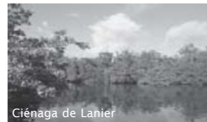
Ciénaga de Lanier

Na zijn vrijlating trok Castro naar Mexico waar hij zijn volgende stappen ging voorbereiden. De Presidio Modelo is in elk geval een ietwat grimmig maar desalniettemin intrigerend en interessant bezoek.