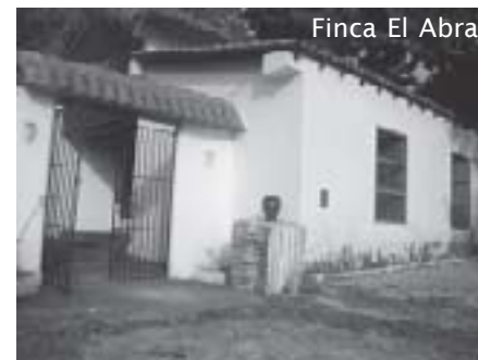
Finca El Abra

naar het – toen nog – Isla de Pinos gedeporteerd waar hij negen weken doorbracht in de Finca El Abra. Die Finca is vandaag de dag nog te bezoeken, op een boogscheut van Nueva Gerona.